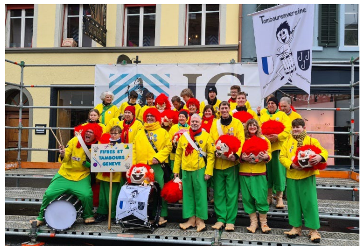
... und ohne