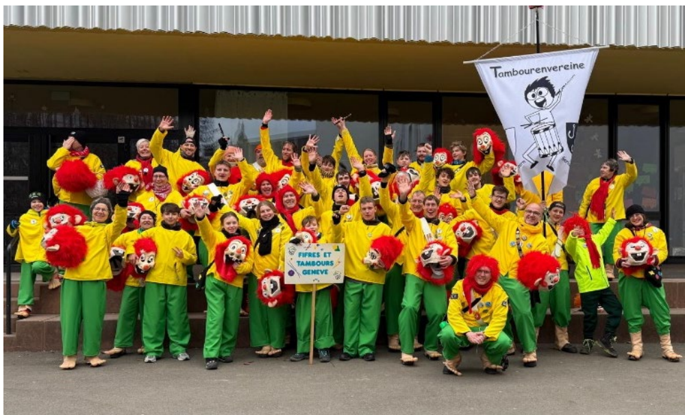
...und ohne Grind an der Emmer Fasnacht