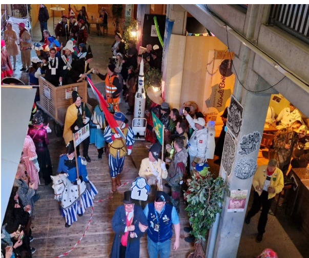
Einzug in den Saal der Luzerner Messe

Zu meiner Schande war ich noch nie an einem Guuggali.