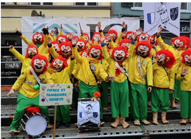
Pumuckls mit Grind....

Um 13.30 Uhr treffen wir uns dann alle wieder auf dem alten Postplatz, geben so quasi zum Einspielen ein ganz kurzes Platzkonzert, danach verschieben wir uns Richtung Pfistergasse, wo wir auf der dort aufgebauten Tribüne unser abwechslungsreiches Programm zum Besten geben.