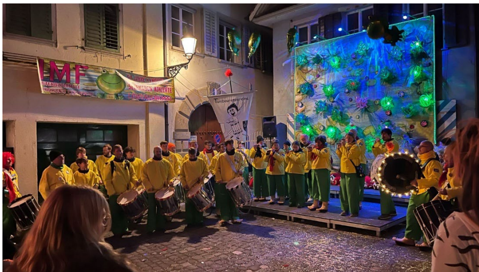
Auftritt in der Münzgasse

Die einen machten sich müde und glücklich auf den Heimweg, die anderen mischten sich unter die Fasnachtsmeute und .... aber lassen wir das. Schön war es auf jeden Fall.