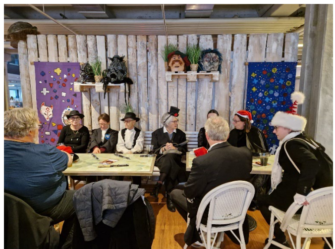
Gemütliches Beisammensein nach der «Arbeit»